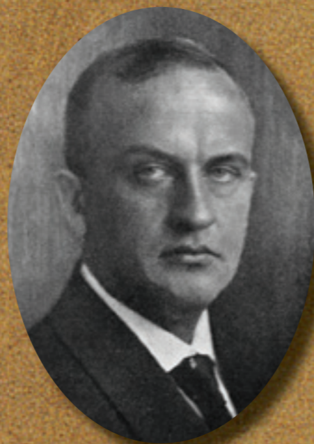
Jan Kotěra nar. 1871 v Brně, zemřel 1923 v Praze

Jan Kotěra byl architektem mezinárodního významu a vůdčí osobností české moderní architektury. Jeho rané stavby mají secesní charakter s ornamentálním dekorem, pozdější Kotěrovy stavby již sledují ryzí účelnost. Mimo jiné byl také urbanista, teoretik architektury, návrhář nábytku a malíř. Podle jeho návrhu vznikla v Králově Dvoře roku 1920 dělnická kolonie u Dibeřského potoka.